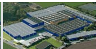
Hörmann KG Brockhagen