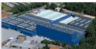
Hörmann KG Amshausen