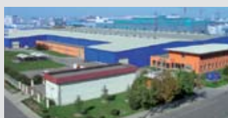
Hörmann Beijing, China