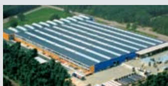
Hörmann Genk NV, Belgien