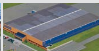
Hörmann Gadco LLC, Vonore TN, USA

Hörmann - единственный производитель на международном рынке, предлагающий «из одних рук» все основные строительные элементы, которые изготавливаются на высокоспециализированных предприятиях в соответствии с новейшими техническими достижениями. Имея широкую торговую и сервисную сеть в Европе и представительства в Америке и Китае, Hörmann является надежным поставщиком высококачественных строительных конструкций. Hörmann - качество без компромиссов.