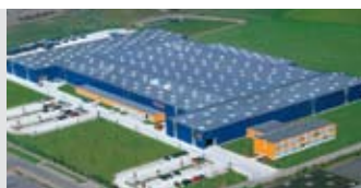
Hörmann KG Brandis