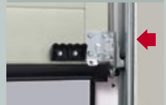
7 Скрытая запасовка троса

Защита от травм благодаря скрытой запасовке троса между полотном ворот и коробкой.