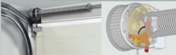
5 Техника с торсионными пружинами

Техника с торсионными пружинами с встроенной защитой от поломки пружин. Благодаря ей ворота не падают даже при поломке пружины.