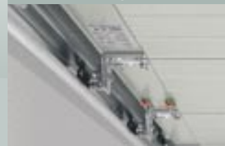
3 Направляемые ходовые ролики

Надежно направляемые ходовые ролики, выход их направляющих невозможен.