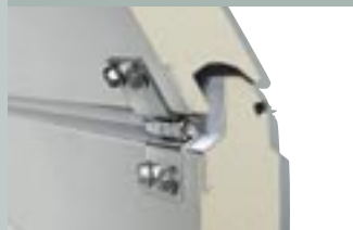
2 Защита от защемления в деталях

Благодаря уникальной форме панелей ворот отсутствуют места защемления, как между ламелями, так и на шарнирах.