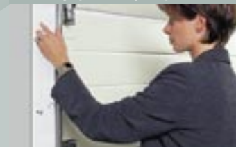
4 Защита от проникновения внутрь сбоку ворот

Боковые коробки полностью закрыты. Благодаря этому проникновение внутрь невозможно.