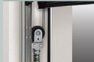
6 Система пружин растяжения

С защитой от падения с помощью системы пружин растяжения. Одинарная система или двойная система пружина в пружине надежно удерживает ворота в неподвижном положении.